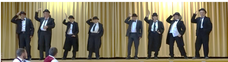
Sportverein Großkuchen / Abt. Fitness