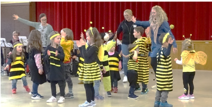
Sportverein Großkuchen / Abt. Kinder- / Zwergenturnen