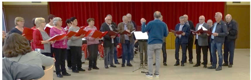
Gesangverein Sangeslust Kleinkuchen