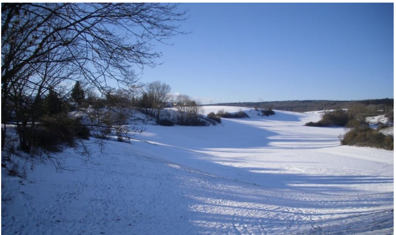
Blick in das Wiesenteich