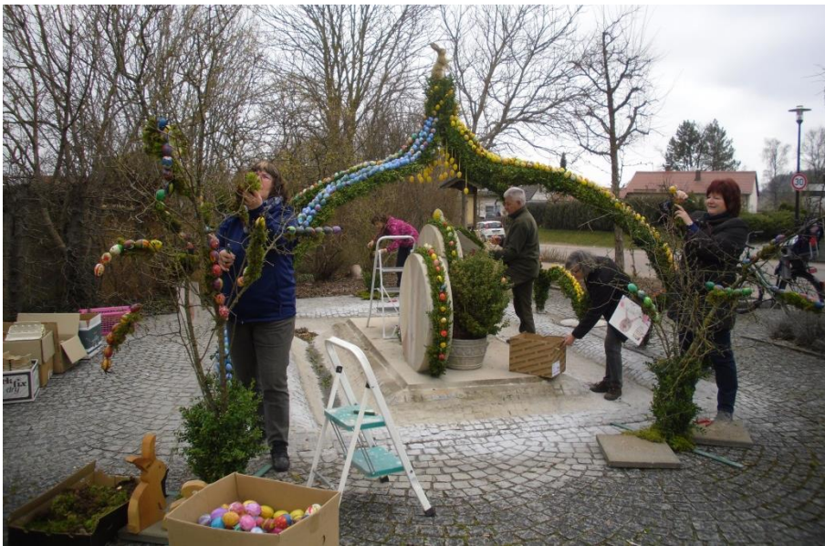
Die Mitglieder des Obst- und Gartenbauvereins Großkuchen beim Aufbau und Schmücken des Osterbrunnens .

Der April überraschte alle nochmals mit einem Wintereinbruch. Der den Frühling ankündigende Osterbrunnen konnte dieses Jahr auch einmal im Winterkleid betrachtet werden.