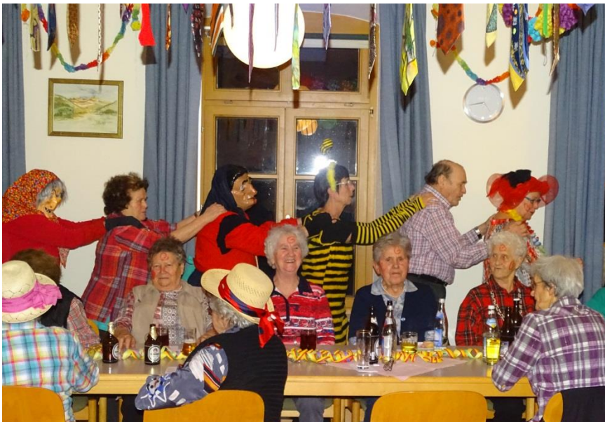
Anschließend statteten sie der Faschingsveranstaltung des Rentner- und Seniorenclubs Großkuchen einen Besuch ab.