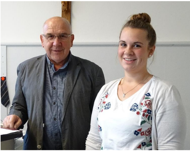
Bei der Ortschaftsverwaltung Großkuchen gab es im September einen Wechsel bei den Mitarbeiterinnen.