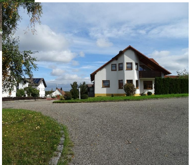
Die Kapellbergstraße und Teile der Ebnater Straße erhielten einen Spritzbelag.