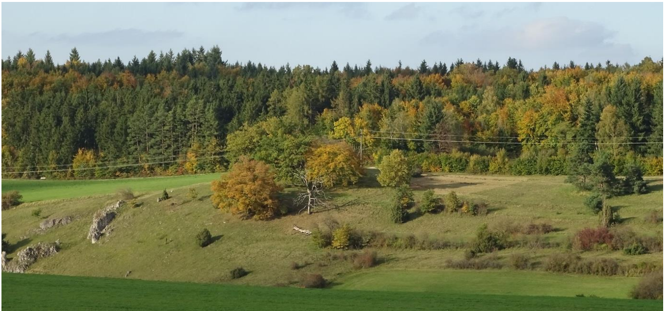
Blick auf den Buchhaldeberg