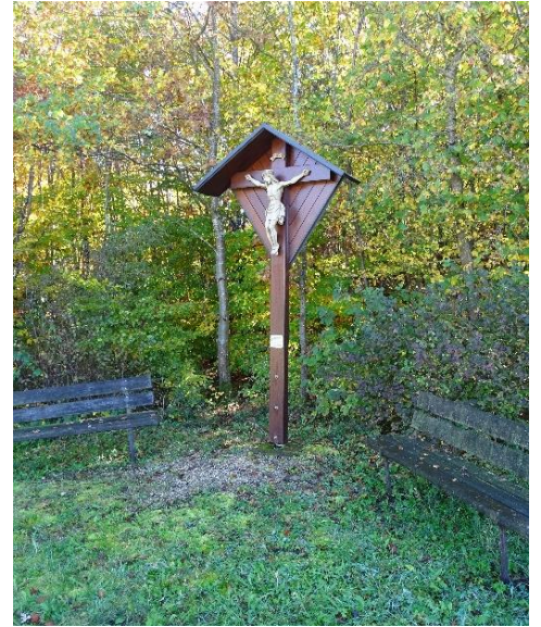
Feldkreuz bei Kleinkuchen