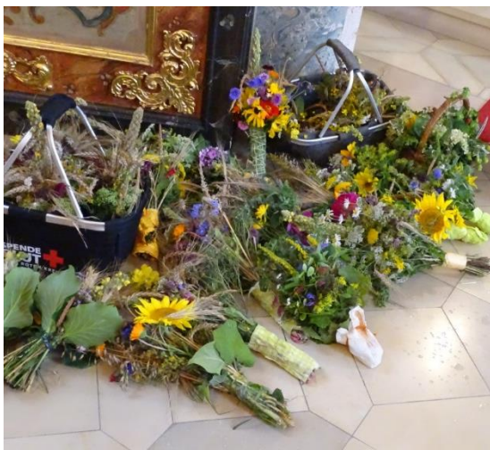
An Mariä Himmelfahrt konnte die Kräuterweihe nicht wie gewohnt an der Mariengrotte stattfinden. Aufgrund eines Gewitters musste der Gottesdienst in die Pfarrkirche verlegt werden.