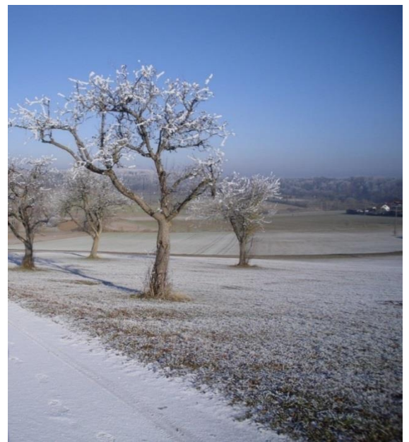
Alte Ebnater Straße