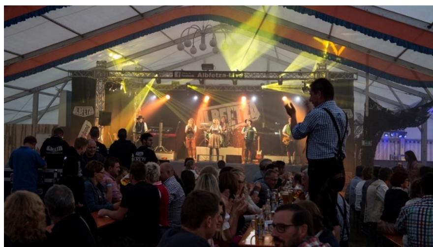
Großer Festabend in der Turn- und Festhalle, der Sportverein Großkuchen feierte seinen 50. Geburtstag . Ein tolles Rahmenprogramm zu Ansprachen und Ehrungen.

Anfang Juli wurde im Festzelt beim Sportplatz weitergefeiert. Abschluss war ein Freundschaftsspiel SV Großkuchen – 1. FC Heidenheim.