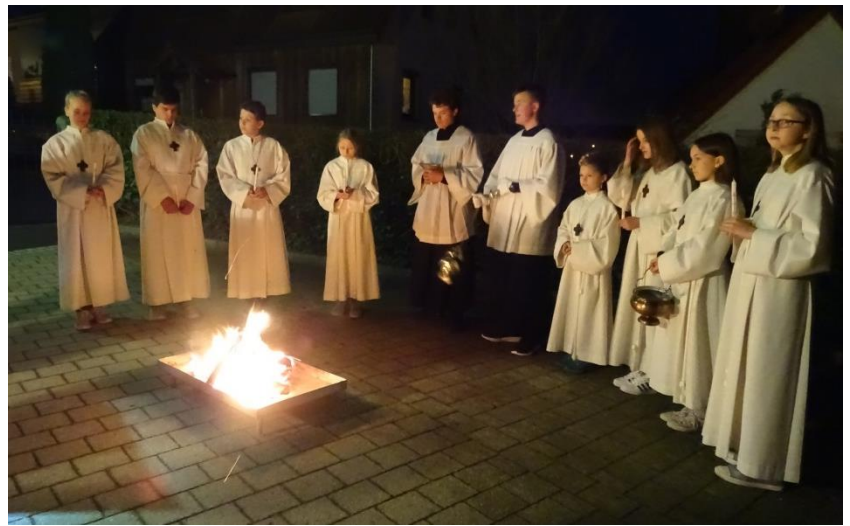
In der Osternacht versammelten sich der Pfarrer, die Ministantinnen und Minstanten vor Gottesdienstbeginn auf dem Vorplatz der Kirche am Osterfeuer .