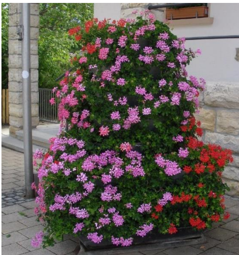
Blumenpyramide auf dem Rathausvorplatz

Die Grundschule Großkuchen nahm am Zeitungsprojekt „Wir lesen junior“ in Kooperation mit der Heidenheimer Zeitung teil.