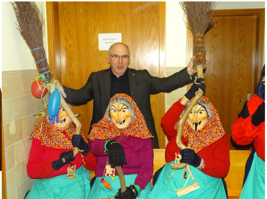
Am Gumpendonnerstag haben die „Gloikucher Hexa“ aus Kleinkuchen im Rathaus Großkuchen die Herrschaft übernommen.