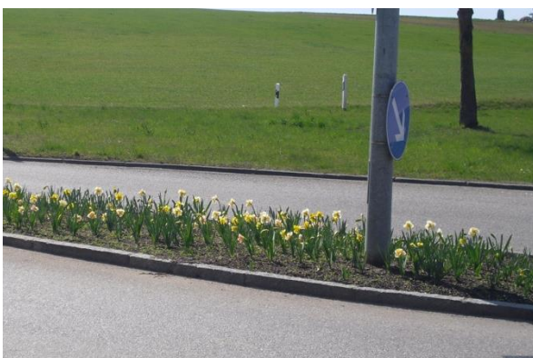
Die Stadtgärtner sorgten bei den Verkehrsinselfn für Frühlingserwachen.