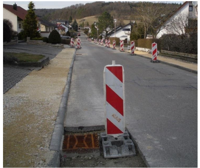
Die Gehwege in der „Lange Straße“ und der „Pfaffensteigstraße“ wurden saniert und mit Leerrohren versehen.