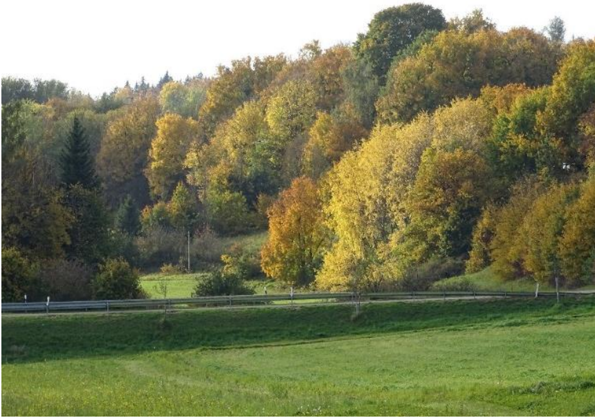
Blick in das Hirntal