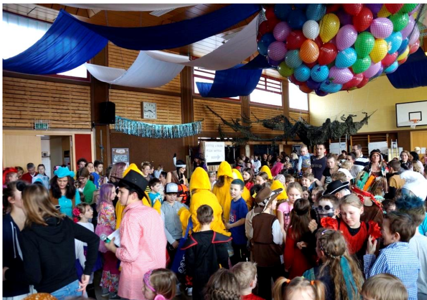
Als Besuchermagnet für alle „kleinen Narren“ erwies sich der Kinderfasching des Musikvereins Großkuchen in der Turn- und Festhalle.