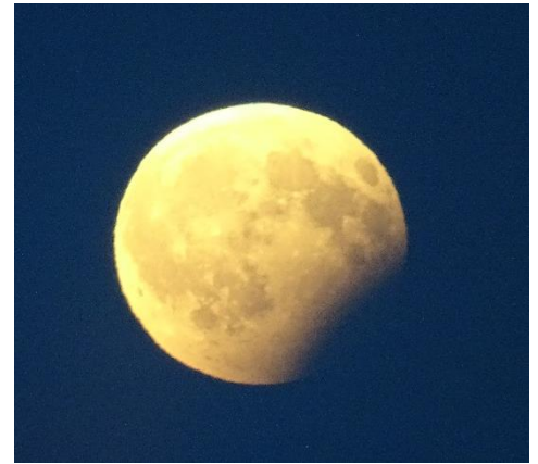
Am 7. August war die partielle Mondfinsternis gut zu sehen.