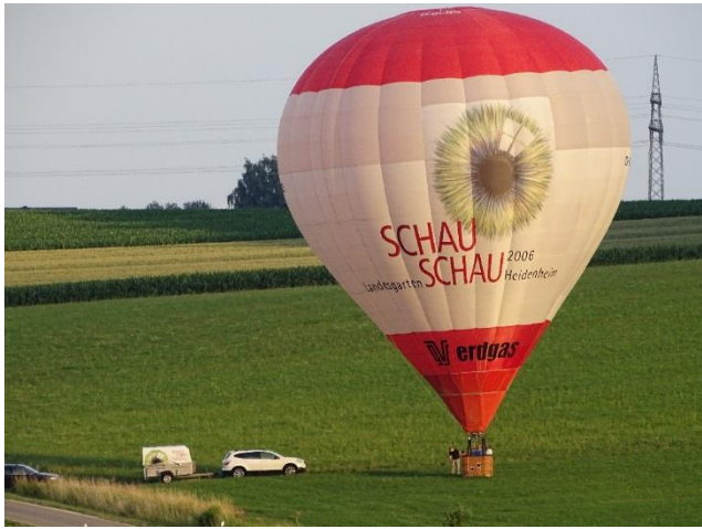
Ballonlandung im Hirnhau