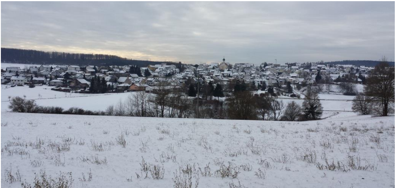
Blick vom Buchhaldeberg auf das verschneite Großkuchen

19 Jugendliche aus der Gesamtortschaft Großkuchen empfangen am 5. Februar 2017 das Sakrament der heiligen Firmung in der Sankt- Bonifatius-Kirche in Schnaitheim.