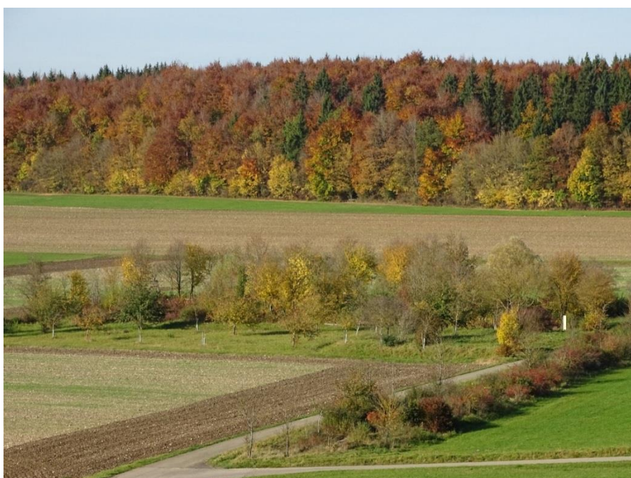
Blick auf den herbstlichen Eisenbrunnen