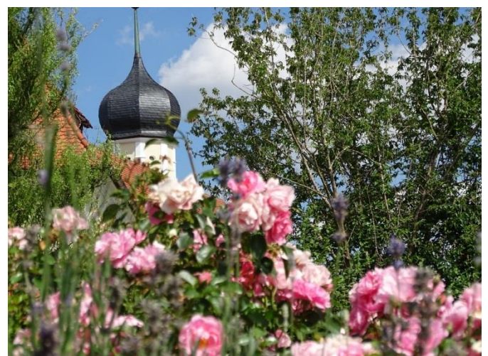
Blumige Ansichten von Großkuchen