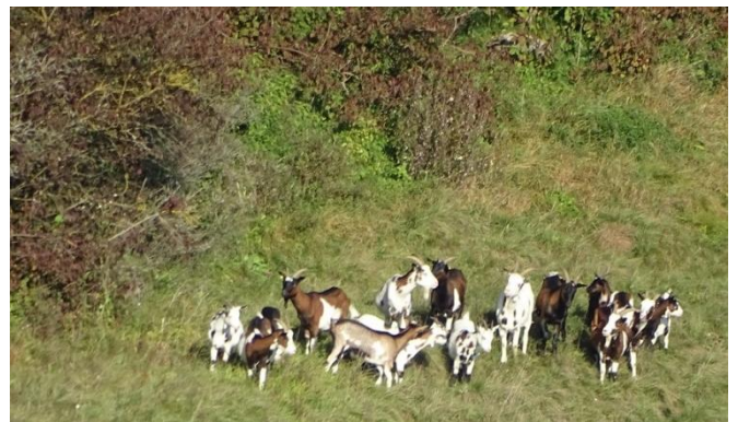
Heidepflege im Eberstal auf andere Art.