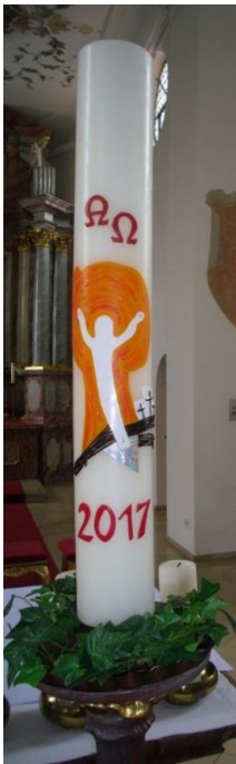
Osterkerze der St.-Peter-und- Paul-Kirche Großkuchen.