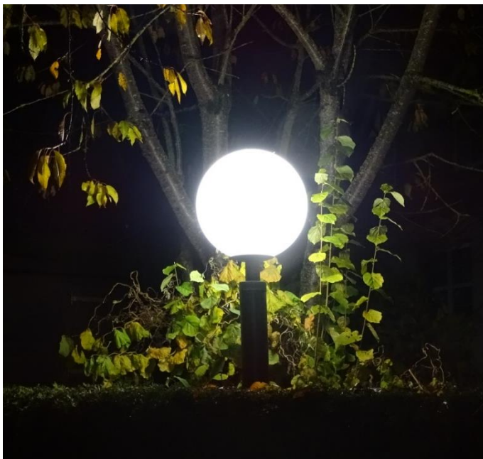
Der Weg zum Eingang der Turn- und Festhalle und der Friedhof in Großkuchen erhielten neue stromsparende LED-Lampen .

Am 11.11.2017 fand zum wiederholten Male die ADAC Rallye Baden-Württemberg rund um Groß- und Kleinkuchen statt. 49 Teams waren am Start.