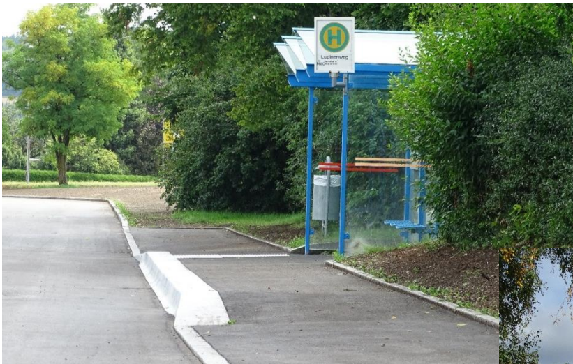
Im Lupinenweg wurden die Abwasserkanäle erneuert und die Straße erhielt einen neuen Belag.